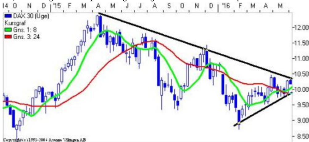
Dax på ugebasis.

Tobii har været i en stigende tendens siden bundformation i februar. Stigningen betyder, at der er etableret et købssignal i Bollingerkanalen på ugebasis niveauet og det samme er tilfældet for Parabolic på ugebasis. De glidende gennemsnit har etableret et "Golden Cross". Der er endvidere en positiv tendens i de tre indikationsmodeller på ugebasis. RSI har ramt niveauet 82-83 på ugebasis. Aktien har ramt modstandsniveauet 68, som også var et modstandsniveau i den faldende tendens tilbage i december. Næste modstandsniveau er ved 76. Forventer et tilbagefald i aktien til niveauet 60, hvilket giver en opsamlingsmulighed. Aktien er med på kandidatbænken.