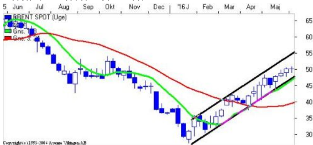
Olien på ugebasis

Guldet har taget et stort hop op efter fredagens amerikanske nøgletal skuffede markedets deltagerne. Guldet blev handlet op i niveauet 1232. Støtteniveauet ved 1200 har stået sin prøve i først omgang. Der er fortsat køb i de to signalmodellerne i Bollingerkanalen og Parabolic på ugebasis. Der er modstand i niveauet 1250 - 1260.