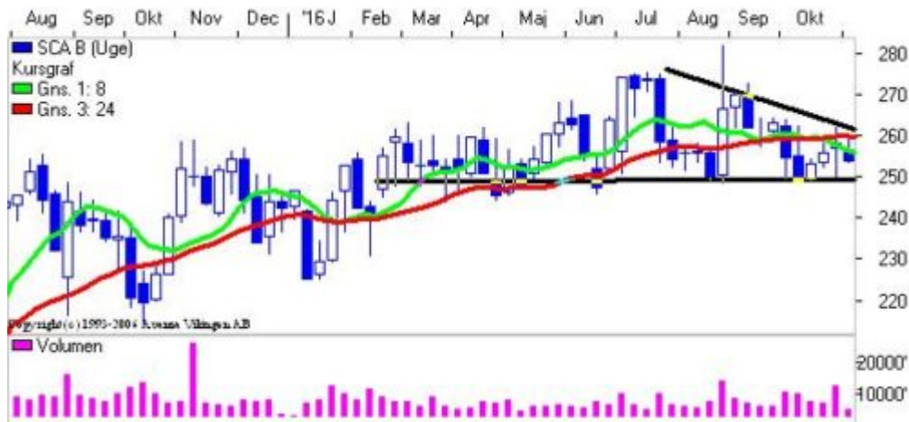
SCA med støtte og en faldende kileformation

SCA konsoliderer sig i niveauet 250-255 og det har nu stået på siden juli. Der var et enkelt udbud i august, da selskabet meddelte, at man vil splitte selskabet i to enheder: hygiejneprodukter og en skovdel. Der er dog ikke kommet flere oplysninger fra selskabet, hvilket har fået aktien til at falde tilbage på ugebasis. Der er divergens mellem de to signalmodeller, idet Bollingerkanaler er i køb og Parabolic er i salg. Der er en faldende tendens i indikationsmodellerne og RSI er under 40 på ugebasis, så der er lagt op til en rebound-mulighed i den kommende tid. Momentum på månedsniveauet har etableret en bundformation, og det bekræfter, at der kan komme en positiv tendens i løbet af 1-3 måneder. Aktien tages med på kandidatbænken.