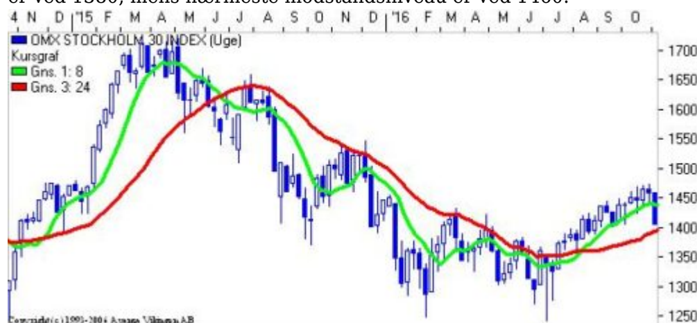
S30 på ugebasis

OMX Stockholm 30 er som de øvrige markeder faldet tilbage til niveauet 1420 og næste støtteniveau er ved 1380, mens nærmeste modstandsniveau er ved 1460.