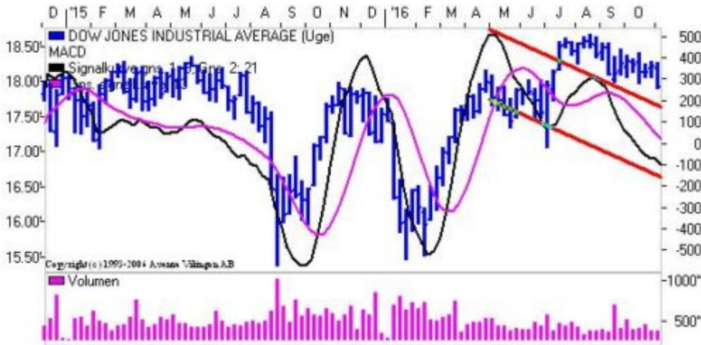
Dow Jones på ugebasis.

Dow Jones Industrial Average fortsætter den faldende tendens og handles nu under 18.000 for første gang siden juli. Den faldende tendens i indekset trækker ned i Momentum og RSI på ugebasis. RSI er under 35 på ugebasis. Den faldende tendens i Momentum er aftagende på ugebasis. De glidende gennemsnit har etableret et "Death Cross" på ugebasis. Nærmeste støtteniveau er ved 17.800-17.900 og herefter i niveauet 17.500-17.600.