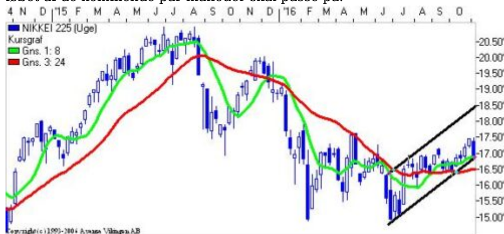
Nikkei på ugebasis

Købssignalet i det japanske indeks holder fortsat, og der er en positiv tendens i indekset. Nærmeste modstandsniveau er ved 17.500 og herefter i niveauet 19.000, mens nærmeste støtteniveau er ved 16.800 og herefter i niveauet 16.400. Der er fortsat en positiv tendens i de tre indikationsmodeller på ugebasis. Momentum har etableret en topformation på månedsniveauet, så det indikerer, at man i løbet af de kommende par måneder skal passe på.