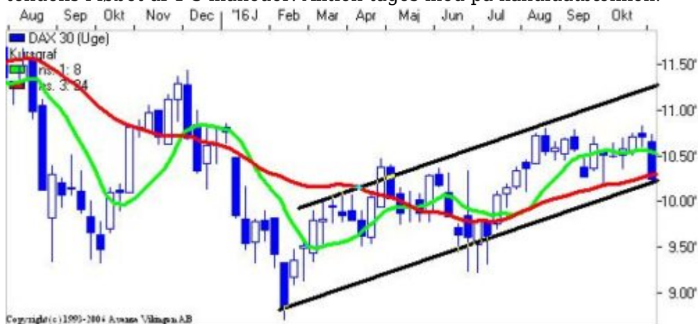
DAX på ugebasis

SCA konsoliderer sig i niveauet 250-255 og det har nu stået på siden juli. Der var et enkelt udbud i august, da selskabet meddelte, at man vil splitte selskabet i to enheder: hygiejneprodukter og en skovdel. Der er dog ikke kommet flere oplysninger fra selskabet, hvilket har fået aktien til at falde tilbage på ugebasis. Der er divergens mellem de to signalmodeller, idet Bollingerkanaler er i køb og Parabolic er i salg. Der er en faldende tendens i indikationsmodellerne og RSI er under 40 på ugebasis, så der er lagt op til en rebound-mulighed i den kommende tid. Momentum på månedsniveauet har etableret en bundformation, og det bekræfter, at der kan komme en positiv tendens i løbet af 1-3 måneder. Aktien tages med på kandidatbænken.