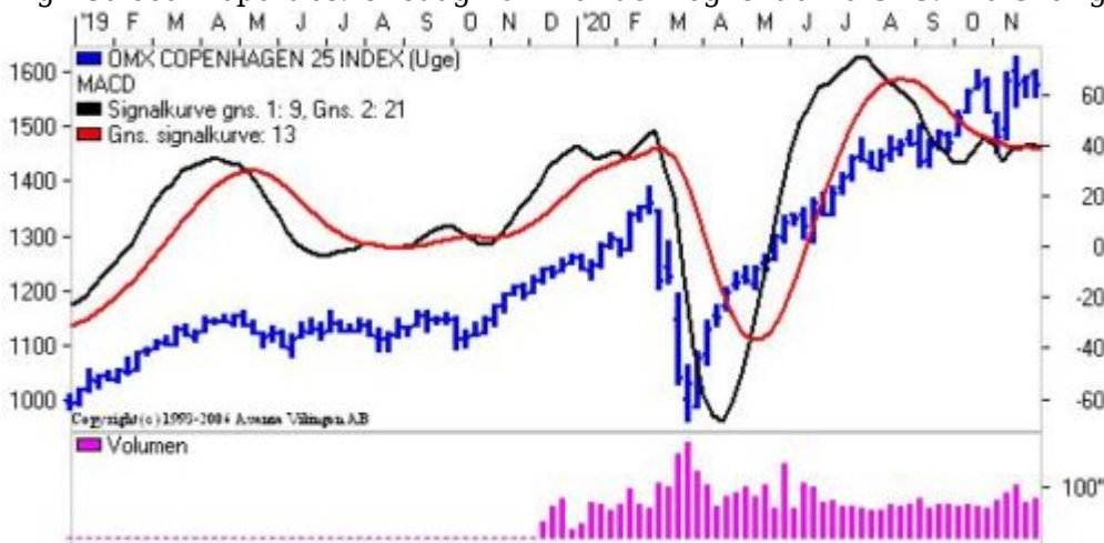
Det danske indeks på ugebasis.

Torsdag var der fokus på Genmab, der var den mest stigende blandt de store danske aktier. Overordnet har aktien bevæget sig vandret siden juli i niveauet 2200-2400. Bollingerkanalen er fortsat i køb og den nedre kanallinie ligger i niveauet 2210. Der er divergens mellem de to indikationsmodeller på ugebasis, idet RSI fortsætter den faldende tendens, mens Momentum har etableret en bundformation og stiger. Nærmeste modstandsniveau er ved 2400 og herefter i niveauet 2600, mens der er støtte i niveauet 2200 og herefter i niveauet 2000. Afvent udviklingen. I denne uge kommer der en del regnskaber fra danske selskaber: Atlantic Petroleum samt German High Street Properties. Onsdag kommer der regnskab fra SAS. Fra Sverige kommer der Clas Ohlson.