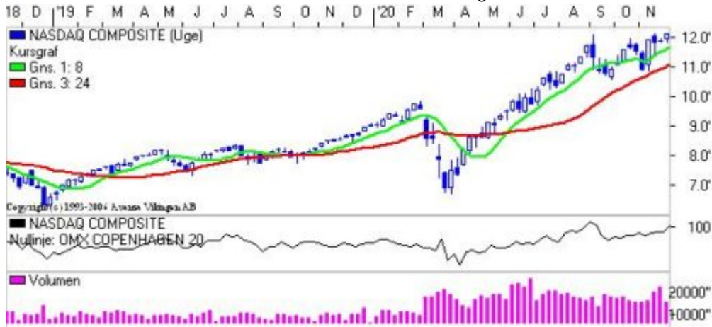
Nasdaq på ugebasis.

S&P 500 holder fast i den stigende tendens omend i langsommere tempo. Købssignalerne i de forskellige modeller er fortsat intakte. Momentum har etableret en bundformation og RSI har ramt 68. Kursen er brudt igennem 3600, så er næste modstandsniveau ved 3700 og herefter i niveauet 3795, mens nærmeste støtteniveau er ved 3400 og herefter i niveauet 3300.