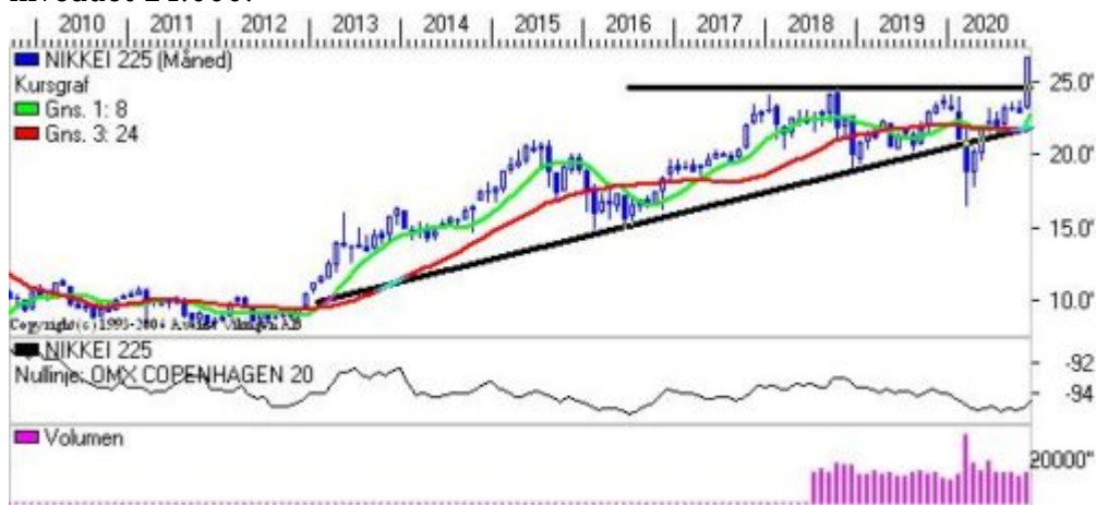
Det japanske indeks er brudt igennem 25.000.

Det japanske marked har taget elevatoren op til et nyt niveau ved 26.000, som man skal tilbage til 90'erne for at finde. RSI har ramt 80. Momentum på ugebasis er brudt igennem det glidende gennemsnit nedefra, hvilket bekræfter den positive tendens i indekset. Nærmeste modstandsniveau er ved 27.000 og herefter i niveauet 28.000, mens der er støtte i niveauet 24.500 og herefter i niveauet 24.000.