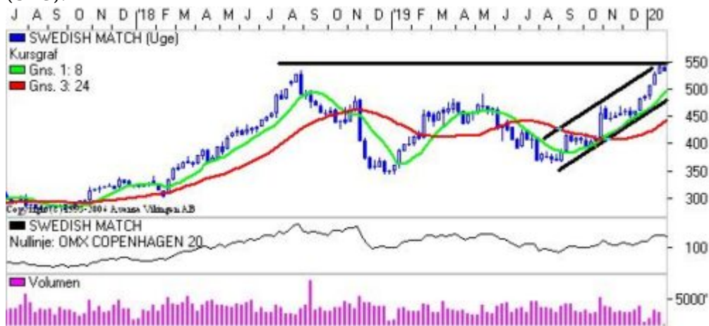
Kursgraf på ugebasis.

Stærk stigning i de to børsnoterede tobaksselskaber Swedish Match og Scandinavian Tobacco Group (STG).