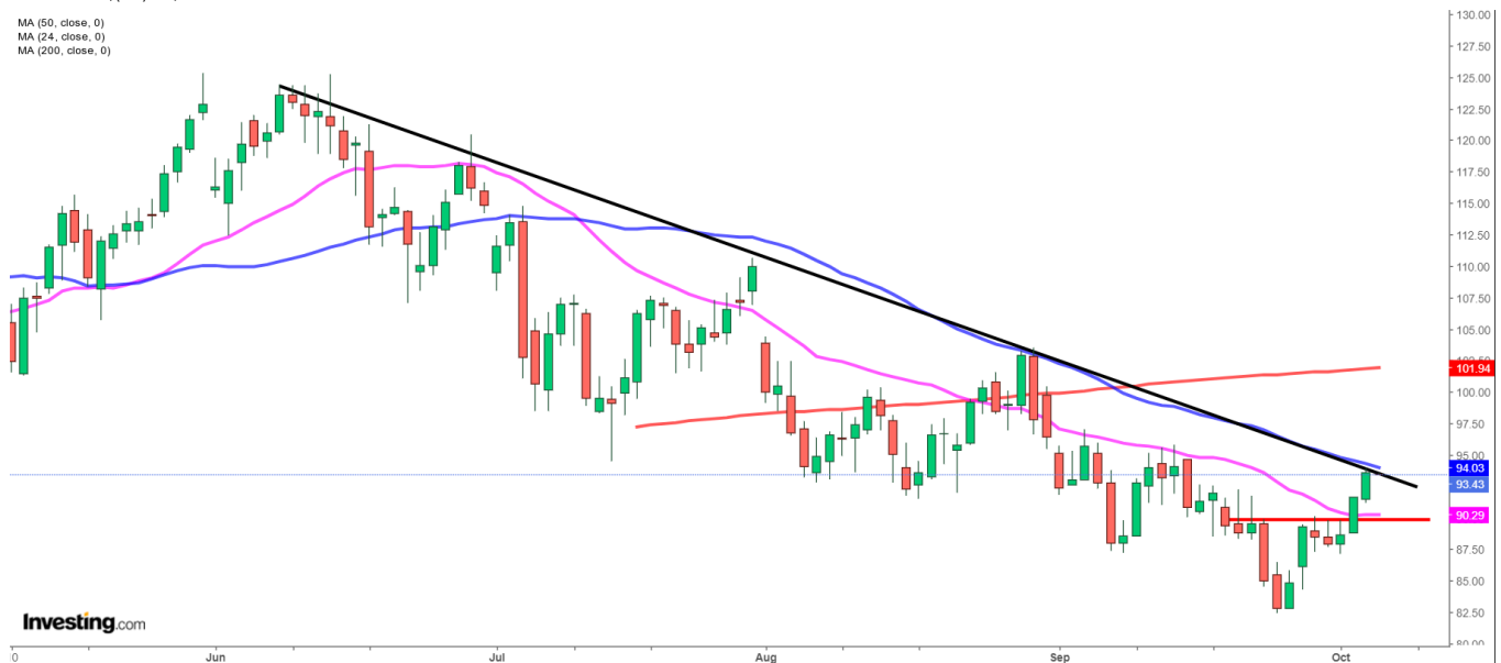
UK Brent: Dagschart

MA (50, close, 0) MA (24, close, 0) MA (200, close, 0)