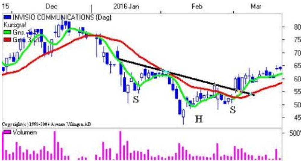
S-H-S formation på dagsniv.

Invisio Communications som var en af de mest stigende aktier på markedet sidste år har taget sig et dyk på 15 pct. Men den seneste måneds tid er aktien begyndt at stige og er steget små 20 kr. Det har trukket op i Momentum, RSI og MACD. Momentum på månedsniveauet har etableret en bundformation.