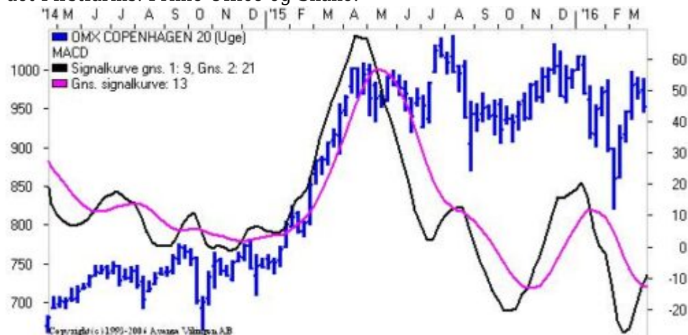
C20 på ugebasis

Den kommende uge er ramt af påsken, men der kommer en række mindre regnskaber. Tirsdag er det Firstfarms, Prime Office og Skako.