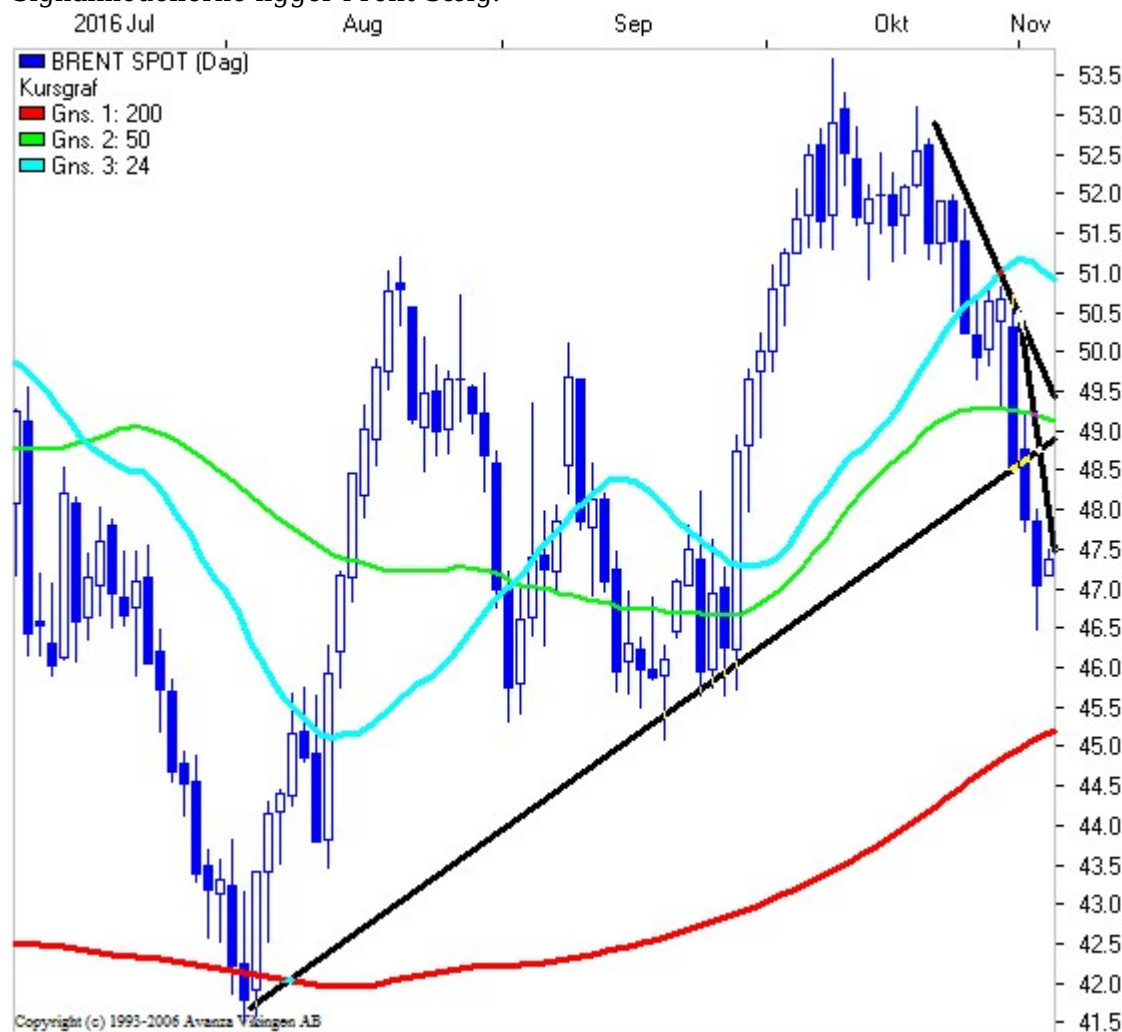
UK Brent: Dagschart