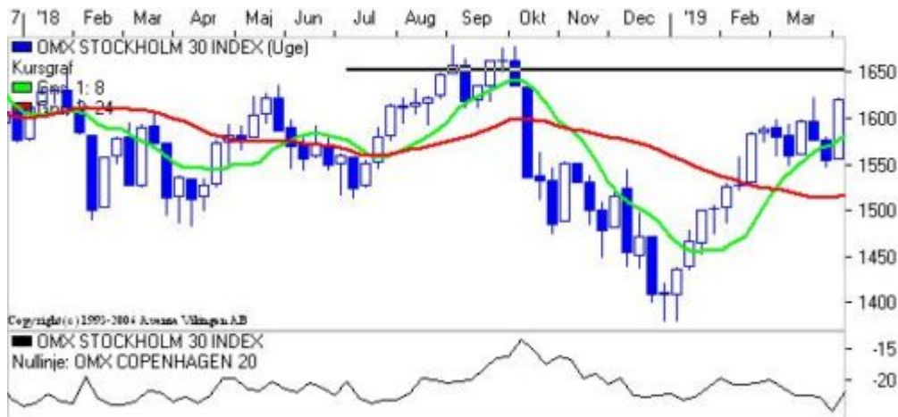
Det svenske indeks på ugebasis.

På ugebasis holder signalmodellerne ligeledes deres købssignaler og Bollingerkanalen har sin nedre kanallinie i niveauet 1550. Det lange glidende gennemsnit ligger i niveauet 1525 og det korte glidende gennemsnit ligger i niveauet 1580.