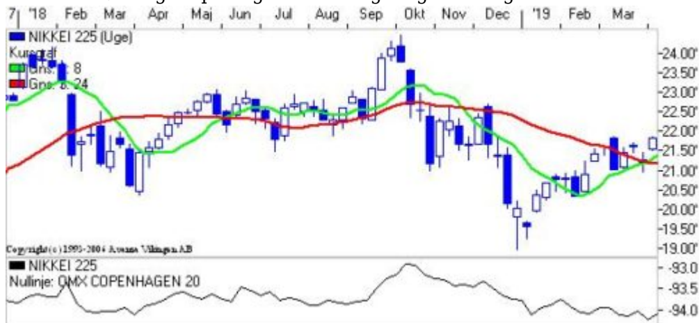
Det japanske indeks.

Efter en kortvarig test af niveauet 21.000 så er indekset hoppet op i niveauet 21.700. Der er etableret købssignal på dagsniveauet og de glidende gennemsnit har etableret et "Golden Cross".