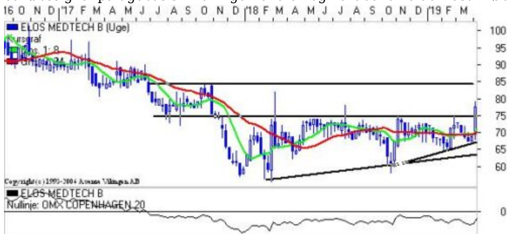
Interessant mindre svenske medico selskab.

Elos Medtech har en markedsværdi på 500 mio. sek. En af de store aktionærer har købt en større portion aktier i ugen, der er gået, hvilket har fået aktien til at stige. Det har fået aktien til at etablere et købssignal på ugebasis i Bollingerkanalen og Parabolic holder fast i købssignalet.