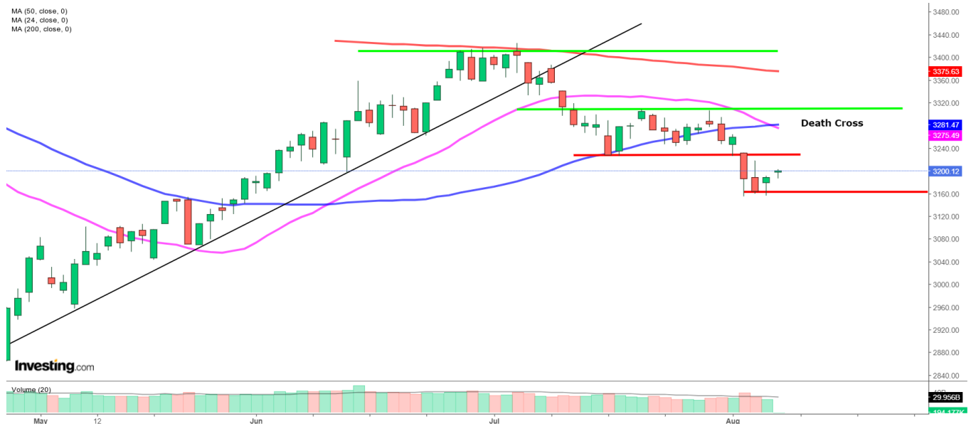
Shanghai Composite: Dagschart

MA (50, close, 0) MA (24, close, 0) MA (200, close, 0)