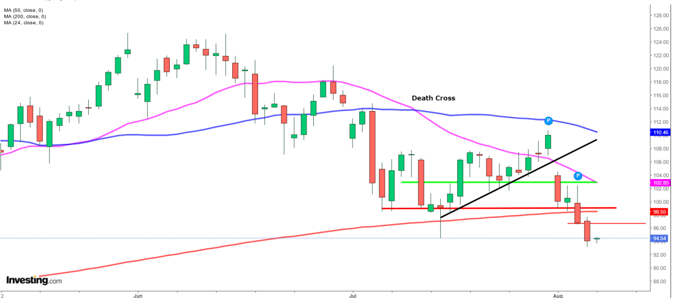
UK Brent: Dagschart

MA (50, close, 0) MA (200, close, 0) MA (24, close, 0)